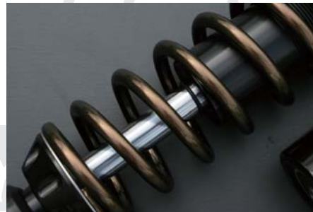
カスタムガンメタ (G)

⚠ 光の当たり具合やご覧になる環境(モニター・印刷機等)により実物とは色合いが異なる場合があります。