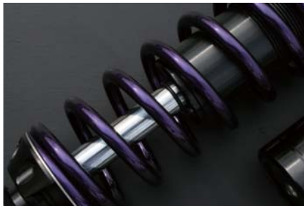
バイオレットパープル (VP)