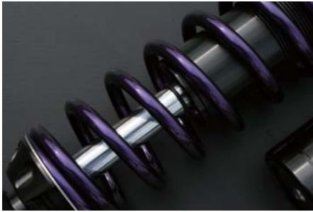
バイオレットパープル (VP)