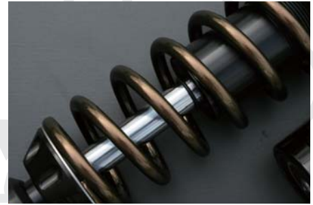
カスタムガンメタ (G)

⚠ 光の当たり具合やご覧になる環境(モニター・印刷機等)により実物とは色合いが異なる場合があります。